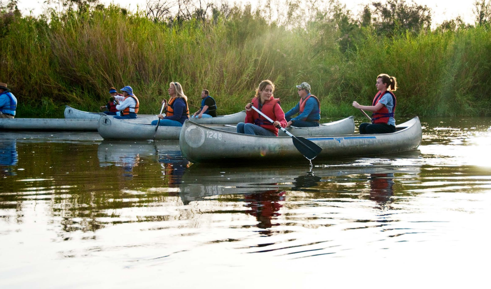
Piragüismo en el Río Colorado.