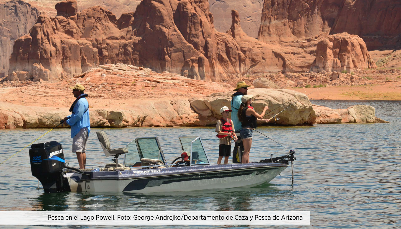
Pesca en el Lago Powell.